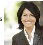
Line Beauchamp Ministre de l'éducation, du loisir et du sport du Québec