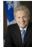
Honorable Jean Charest Bureau du Premier Ministre du Québec

REGROUPEMENT DES ORGANISATIONS DE BASSIN VERSANT DU QUÉBEC ROBQ